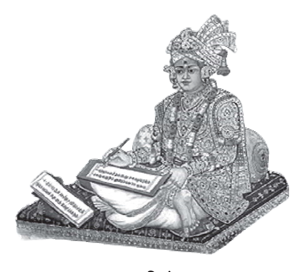
● SMVS સિદ્ધાંત સૂત્ર ● સર્વોપરી સ્વામિનારાયણ ભગવાનની ઉપાસના દંઢ કરી, અનાદિમુક્તની સ્થિતિ પામવી એ જ કારણ સત્સંગ