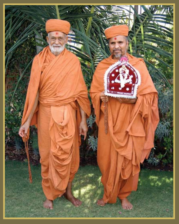
ગુરુવર્ચ ૫.પૂ. બાપજી વ્હાલા ૫.પૂ. સ્વામીશ્રી