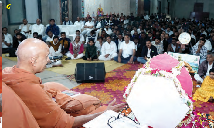
(૧-૨) ગોલા, ઘાટલોડિયા ખાતે અનુક્રમે પધરામણીમાં લાભ (૩-૪) કલોલ ખાતે પધરામણી તથા પાટોત્સવમાં લાભ (૫-૮) દિવ્ય ઝોનલ સત્સંગ વિચરણ : ગોધરા