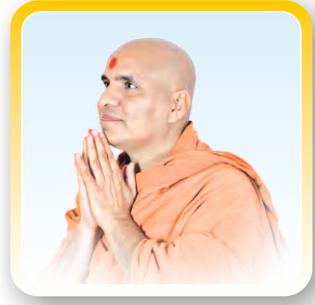
દિવ્ય પ્રેરક ગુરુવર્ય પ.પૂ. સ્વામીશ્રી