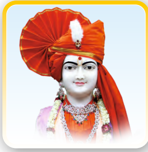
પૂર્ણ પુરુષોત્તમ ભગવાન સ્વામિનારાયણ