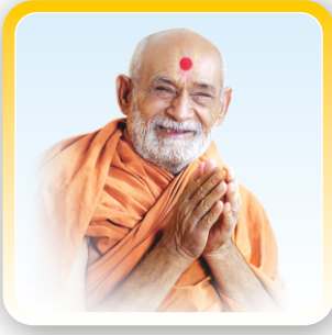
આધ સ્થાપક ગુરુદેવ પ.પૂ. બાપજી