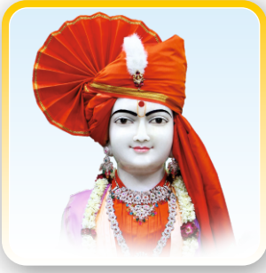
પૂર્ણ પુરુષોત્તમ ભગવાન સ્વામિનારાયણ