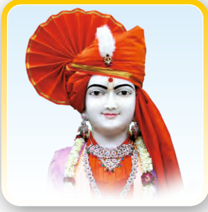
પૂર્ણ પુરુષોત્તમ ભગવાન સ્વામિનારાયણ