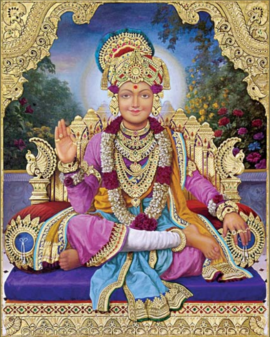
पूर्व पुरुषोत्तम श्री स्वामिनारायण भगवान