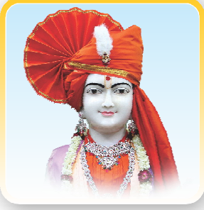
પૂર્ણ પુરુષોત્તમ શ્રી સ્વામિનારાયણ ભગવાન