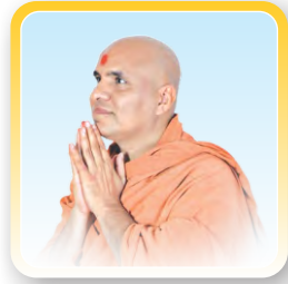
વ્હાલા પ.પૂ. સ્વામીશ્રી