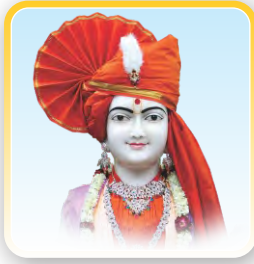
પૂર્ણ પુરુષોત્તમ ભગવાન સ્વામિનારાયણ