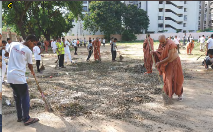
(१-७) पाटण, भाबर, पालनपुर, सतवासणा, मालपुर, हालोल, स्वा. धाम जाते पधरामणी तथा कथावार्तानो लाभ (८) स्वच्छता अभियान अंतर्गत कॅम्पस स्वच्छतानो लाभ वेता व्हावा गुरुजु