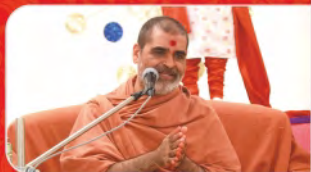
સંત વ્યાખ્યાન માળા