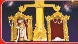
મહારાજ તથા બાપાશ્રીની સુવર્ણ તુલા