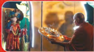
શ્રી હરિ પ્રાગટ્ય દિન