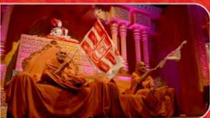
SMVS સંસ્થા દિન