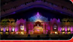
અમીરપેટી મહિમા દિન