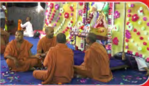
બાપાશ્રી પ્રાગટ્ય દિન