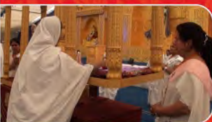
મહિલા સંમેલન (સુવર્ણ તુલા)