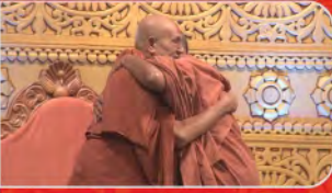
ગુરુદેવ મહિમા દિન