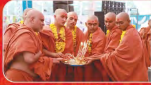
સંત દીક્ષા સમારોહ